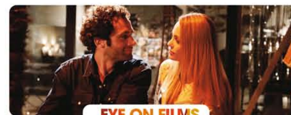
EYE ON FILMS

DI CECILIA VALENZUELA GIOIA ARGENTINA, 2017, HD, COLOR, 64'